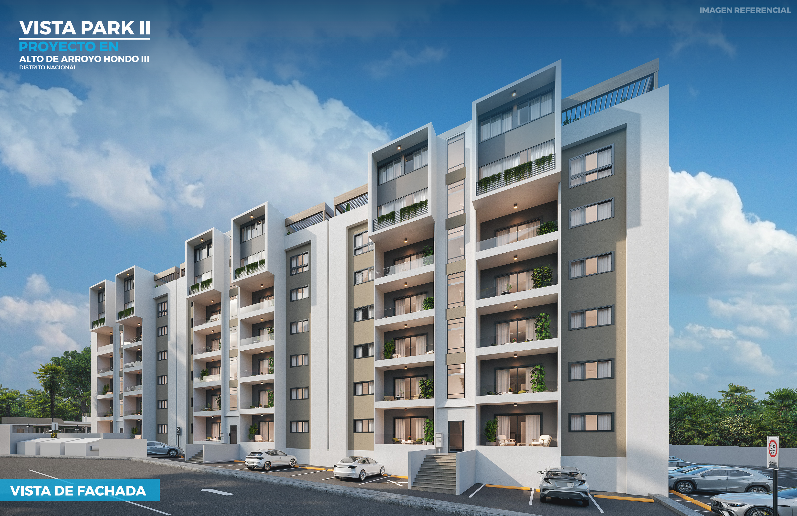
VISTA DE FACHADA