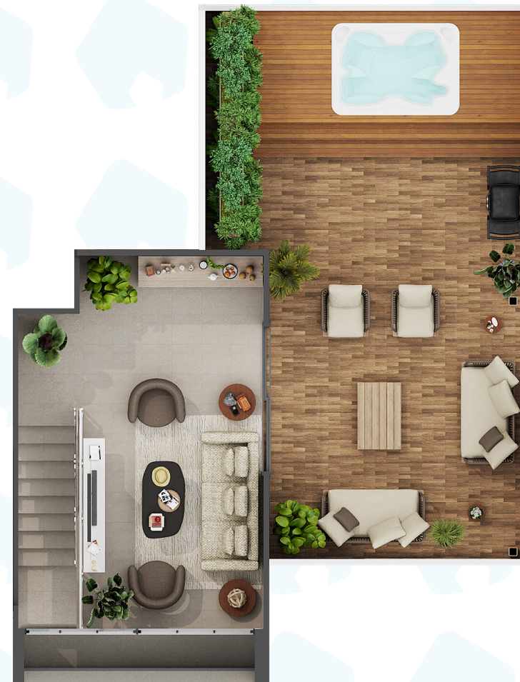
SEGUNDO NIVEL PENTHOUSE

PLANTA ARQUITECTONICA PENTHOUSE APARTAMENTOS DE 181 M2