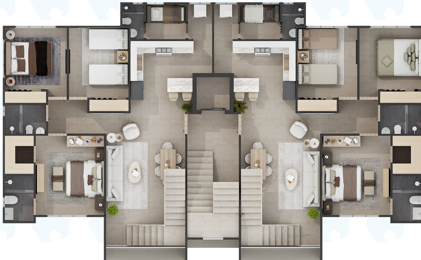
PRIMER NIVEL PENTHOUSE

CADA APARTAMENTO CUENTA CON 3 HABITACIONES 2 PARQUEOS, 2 BAÑOS, DESAYUNADOR, LAVADO, AREA DE SERVICIO 2 SALAS Y TERRAZA TECHADA Y DESTECHEADA EN LA ASOTEA